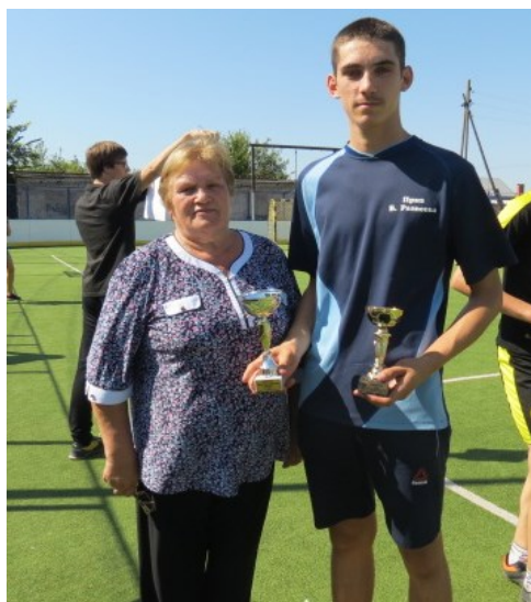
С очередной победой!

- Люблю читать, чего очень не хватает. Очень люблю цветы, выращиваю их. С удовольствием занимаюсь внуками, когда приезжают в гости.