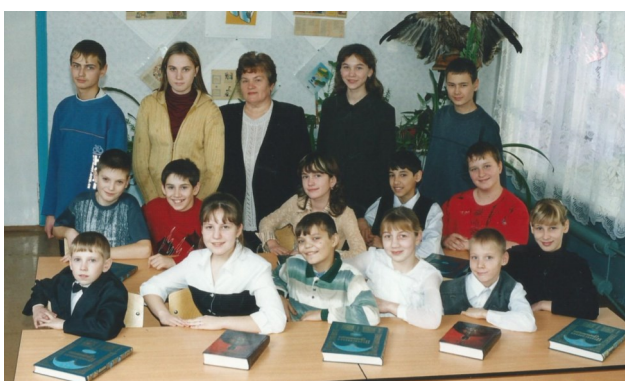
В кругу учеников

- Как Вы думаете, отличаются ли Ваши первые ученики от нынешних?