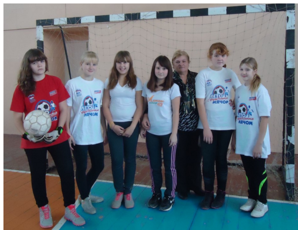
На спортивном празднике

Да, отличаются, и могу сказать, чем. В то время не было таких условий для занятий физкультурой, как сейчас: был всего один мяч, и то со шнуровкой, не было лыж, спортивного зала в этой школе. Дети учились в две смены в двух школах. Сейчас совершенно всё по-другому. Для ребят есть всё необходимое, чтобы заниматься физкультурой и спортом. Но в то время дети хотели заниматься спортом. Не могу сказать, что нынешнее поколение не нуждается в занятиях физкультурой. Движение - это жизнь, и большая часть ребят занимается спортом и понимают, для чего нужна физкультура, но, к сожалению, они больше заняты техническими средствами: больше времени проводят за компьютером и в телефоне, словом, больше находятся дома, ведут малоподвижный образ жизни. Очень обидно.