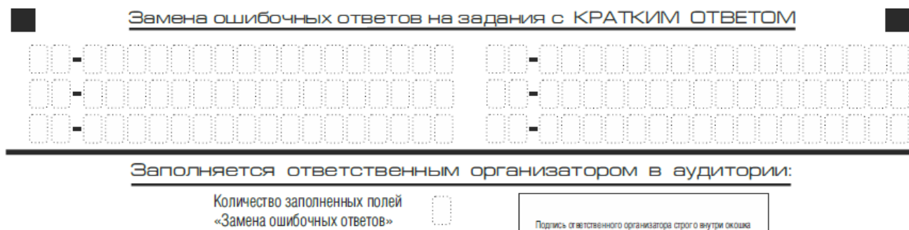
Рис. 9. Область замены ошибочных ответов на задания с кратким ответом

Запрещается записывать ответ в виде математического выражения или формулы. В ответе не указываются названия единиц измерения (градусы, проценты, метры, тонны и т.д.) – так как они не будут учитываться при оценивании. Недопустимы заголовки или комментарии к ответу.